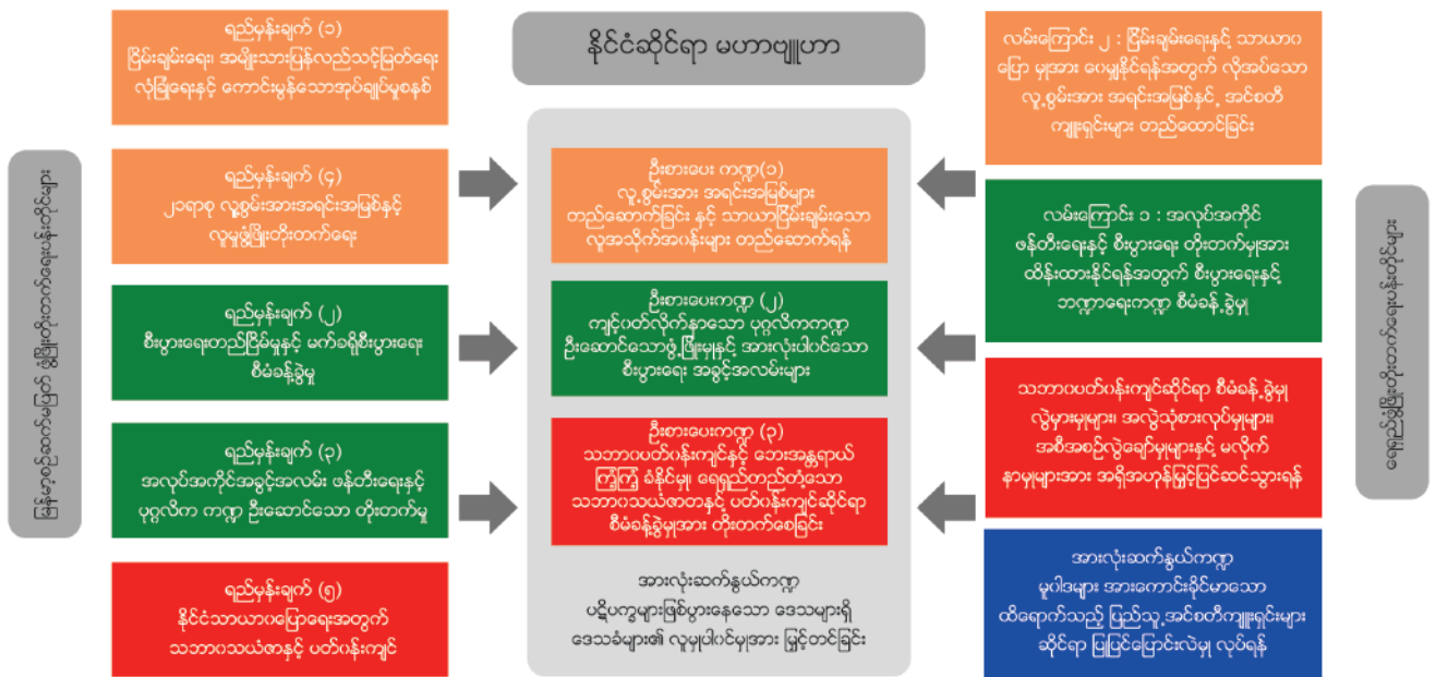
Source : World Bank, 2020. Country Partnership Framework for Myanmar for the period FY20-FY23

ကမ္ဘာ့ဘဏ်၏ အဆိုအရ မြန်မာနိုင်ငံအတွက် ရေးဆွဲ ထားသော နိုင်ငံဆိုင်ရာ မဟာဗျူဟာမှာ ဘဏ်၏ အဓိက ရည်ရွယ်ချက်နှစ်ခုဖြစ်သော ဆင်းရဲနွမ်းပါးမှု လျော့ချခြင်းနှင့် သာယာဝပြောမှုများ မျှဝေနိုင်ရန်အပေါ် မူတည်၍ “စိန်ခေါ်ချက်ကြီးမားသော မြန်မာနိုင်ငံ၏ အသွင် ကူးပြောင်းရေးအတွက် အထောက်အကူပေးရန်” ဖြစ်သည်။ အဆိုပါ ရည်ရွယ်ချက်အားလည်း နိုင်ငံ့အခြေ အနေ စနစ်တကျ လေ့လာဆန်းစစ်ချက်(SCD)နှင့် မြန်မာ့စဉ်ဆက်မပြတ် ဖွံ့ဖြိုးတိုးတက်ရေး ရည်မှန်းချက် ပန်းတိုင်များအပေါ်တွင် အခြေခံ ရေးဆွဲထားသည်ဟု ဆိုသည်။ ထို့အပြင် ယခု မဟာဗျူဟာမှာ လက်ရှိ ဖြစ်ပေါ်နေသော ကိုဗစ်-၁၉ အခြေအနေများ ထည့်သွင်း