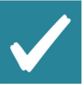
လုပ်ငန်းများပြီးမြောက် အောင်မြင်မှု သုံးသပ်ခြင်းနှင့်သင်ယူခြင်း