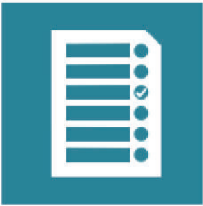
နိုင်ငံအခြေအနေ စနစ်တကျလေ့လာဆန်းစစ်မှု - နိုင်ငံအခြေအနေ ဆန်းစစ်ချက်တစ်ခု

အထက်ပါ ရင်းနှီးမြှုပ်နှံမှုများအား ၂၀၁၄ ခုနှစ်တွင် အကူအညီပေးရေး မူဝါဒအား အစားထိုး ပြင်ဆင်ခဲ့သော နိုင်ငံတွင်း ချိတ်ဆက်ဆောင်ရွက်မှု နည်းလမ်းများဆိုင်ရာ မူဝါဒအရ ပြုလုပ်ထားခြင်း ဖြစ်သည်။ အဆိုပါ မူဝါဒ တွင် အဆင့်လေးဆင့်နှင့် အရေးကြီးသော စာတမ်း ၂ ခု ပါရှိသည်။ နိုင်ငံအခြေအနေ စနစ်တကျ လေ့လာဆန်းစစ်မှု (SCD) နှင့် နိုင်ငံဆိုင်ရာ မဟာဗျူဟာ (CPF) တို့သည် အမှန်တစ်ကယ်နိုင်ငံတွင်း ရင်းနှီးမြှုပ်နှံမှုများ အတွက် ဖော်ပြချက်များ ပါရှိသည်။ နိုင်ငံအခြေအနေ စနစ်တကျ လေ့လာဆန်းစစ်မှုသည် နိုင်ငံအတွင်း အခြေအနေ အရပ်ရပ်အား စနစ်တကျလေ့လာ ဆန်းစစ်ပြီး တွေ့ရှိချက်များအား နိုင်ငံဆိုင်ရာ မဟာဗျူဟာ ရေးဆွဲရာ တွင် အသုံးပြုသည်။ ကမ္ဘာ့ဘဏ်၏ လိုအပ်ချက်များ အရ အဆိုပါ လုပ်ဆောင်ချက်များတွင် အစိုးရအပြင် အခြားသော ပူးပေါင်းဆောင်ရွက်သူများ ဖြစ်သည်။ အရပ်ဖက် အဖွဲ့အစည်းများနှင့်လည်း တိုင်ပင် ဆွေးနွေးမှုများ ပြုလုပ်ရမည် ဖြစ်သည်။ အခြားသော အဆင့် နှစ်ခုမှာ လုပ်ငန်းများအား သုံးသပ် သင်ယူခြင်း (PLR) - လုပ်ငန်းတိုးတက်မှုများအား ဆန်းစစ်ခြင်း (တစ်ဝက်) နှင့် လိုအပ်သော ပြုပြင်ပြောင်းလဲမှုများ လုပ်ခြင်းနှင့် လုပ်ငန်းများ ပြီးမြောက်အောင်မြင်မှု သုံးသပ်မှုခြင်းနှင့် သင်ယူခြင်း ( CLR) မှာ ၎င်းတို့၏ ရင်းနှီးမြှုပ်နှံမှု မူဝါဒများ အား ပြန်လည်သုံးသပ်ခြင်းဖြစ်ပြီး ရလဒ်များအား ထပ်မံရေးဆွဲမည် နိုင်ငံအခြေအနေ စနစ်တကျ လေ့လာ ဆန်းစစ်မှုနှင့် နိုင်ငံမဟာဗျူဟာ ရေးဆွဲရေးအတွက် ထည့်သွင်း စဉ်းစားရသည်။