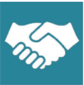
နိုင်ငံဆိုင်ရာ မဟာဗျူဟာ - SCD အပေါ်တွင် အခြေခံရေးဆွဲသည်။