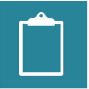
လုပ်ငန်းများအား သုံးသပ်ဆန်းစစ်ခြင်းနှင့် သင်ယူခြင်း